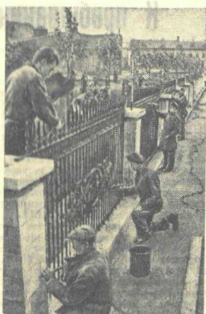
В Москве ведутся большие работы по благоустройству. На снимке: строительство нового сквера на Арбатской площади. Работы ведут смен, где начальником С. С. Сергеев.